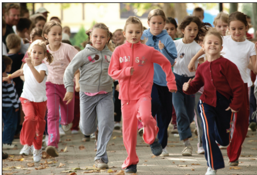
421-en vettek részt október 2-án a Tagore sétányon megrendezett Fut a Füred versenyen.