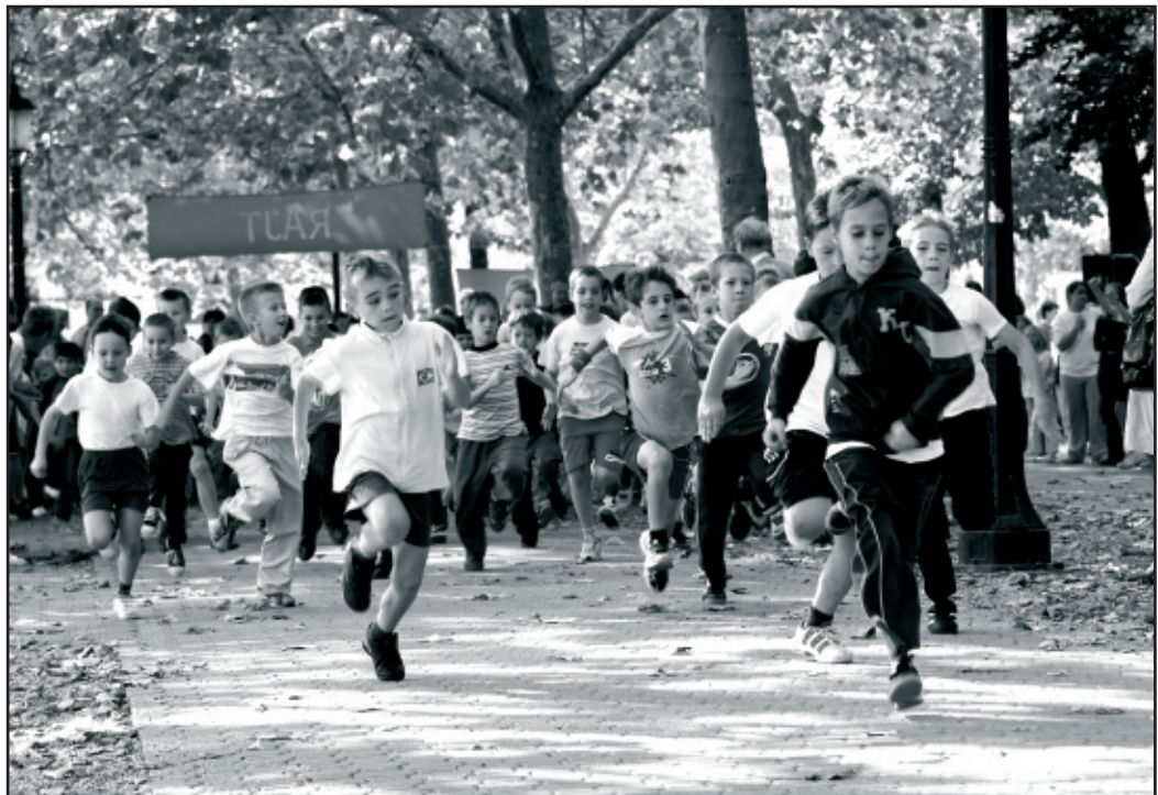
16. alkalommal rendezték meg a Fut a Füred versenyt, amelyen a város általános iskolásai mellett a Kossuth téri óvodások és a pécselyi óvodások és iskolások is részt vettek. A 421 versenyző pólót és üdítőt kapott a szervezőktől. A nyolc korcsoportban indulók helyezetteji érmeiket vihetik haza.